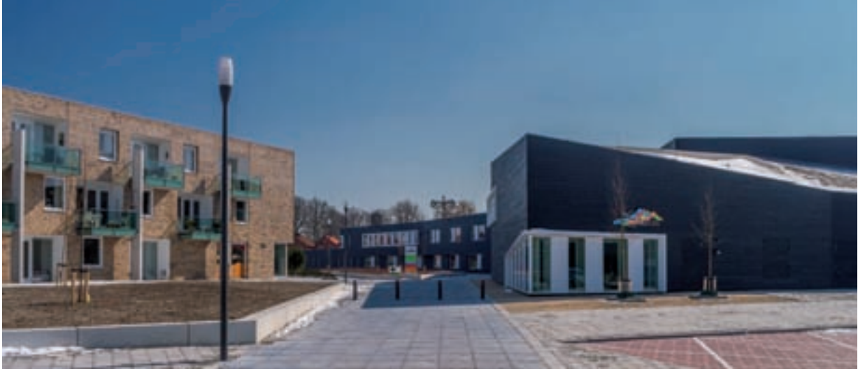
Links het seniorencomplex. Rechtsboven is net de 10 m hoge sporthal zichtbaar.