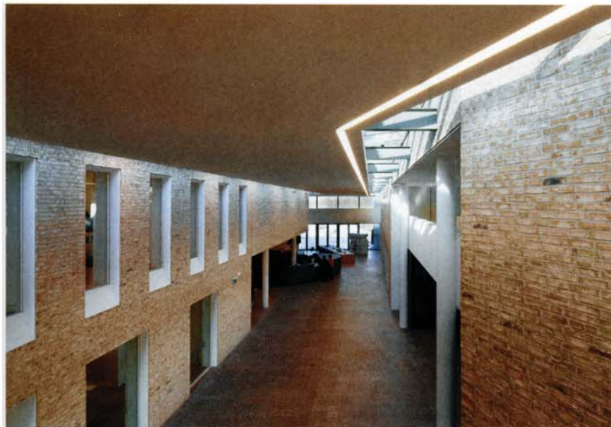
FOTO LINKS De raadzaal